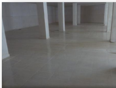
Local Avda. País Valencia, 19 Bajo - Biar