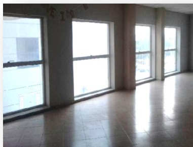
Oficina C/ Santiago Ramón y Cajal, 37 - Elche