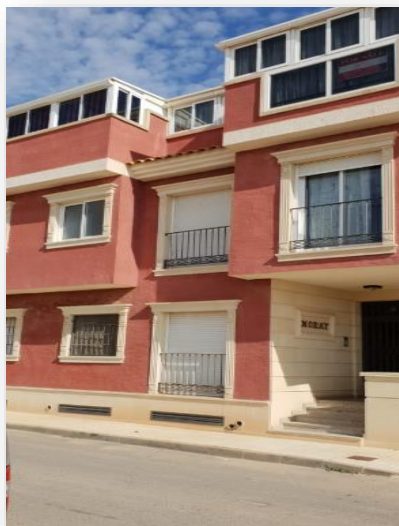
Vivienda en C/ Siglo XXI, 5 Pilar de la Horadada