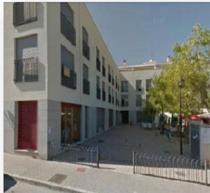
Vivienda en C/ Santa Bárbara, 12 - Xaló