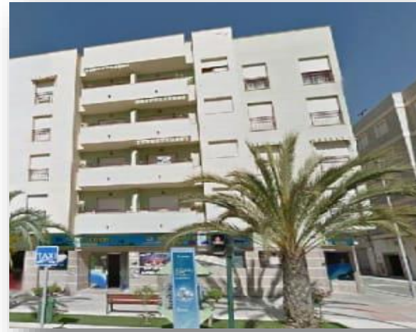
Vivienda en Avda. Alegría, 32 - Elche