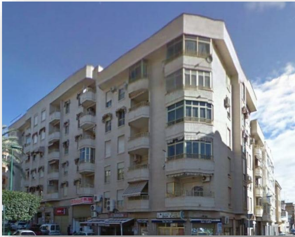
Vivienda en C/Pintor Velázquez, 4 - Crevillente