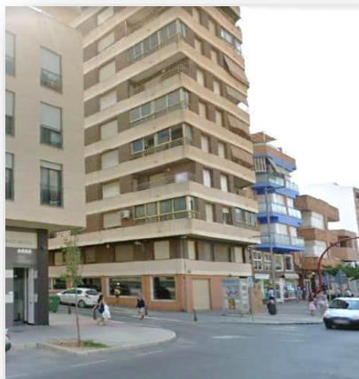
Vivienda en C/ Constitución, 156 - Villena