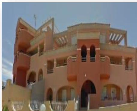
Vivienda en C/ Bahamas, 3 Orihuela Costa