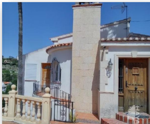
Chalet C/ Remol Bellavista, 21 - Benissa