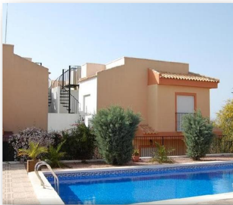
Adosado C/ Pablo Picasso, 15 - Algofra